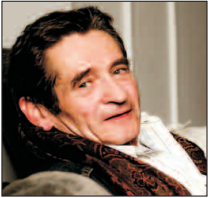
Autor spektaklu Krzysztof Kamiński